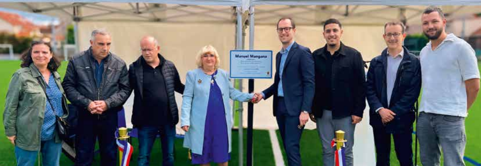
L'inauguration du stade Manuel-Mangana, le 22 juin.