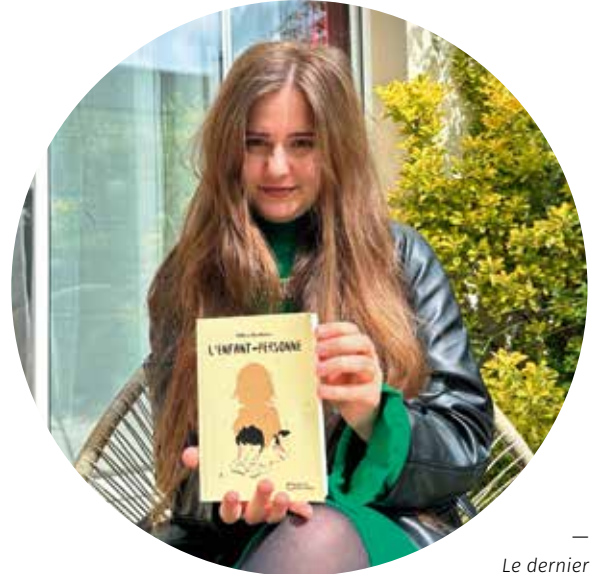
— Le dernier roman d'Hélène Benetreau est sorti le 24 mai.

Son dernier livre, L'Enfant-Personne , évoque les tourments d'Arthur, un petit garçon au premier abord « comme les autres ». On entre dans son univers à travers des lettres qu'il écrit à sa mère. Il partage avec elle ses pensées les plus sombres, ses secrets inavouables et ses