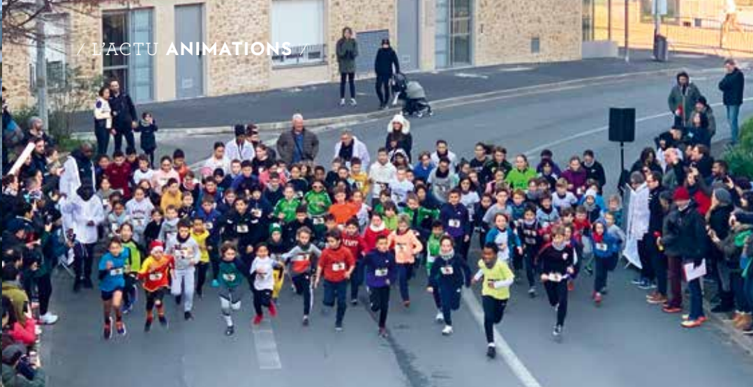
La course des enfants a réuni plus de 100 participants.