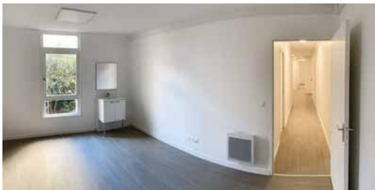
Un des trois cabinets du 54, rue Hoche.