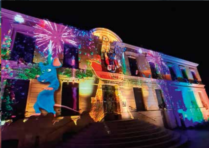
Le mapping vidéo sur la façade de l'hôtel de ville.