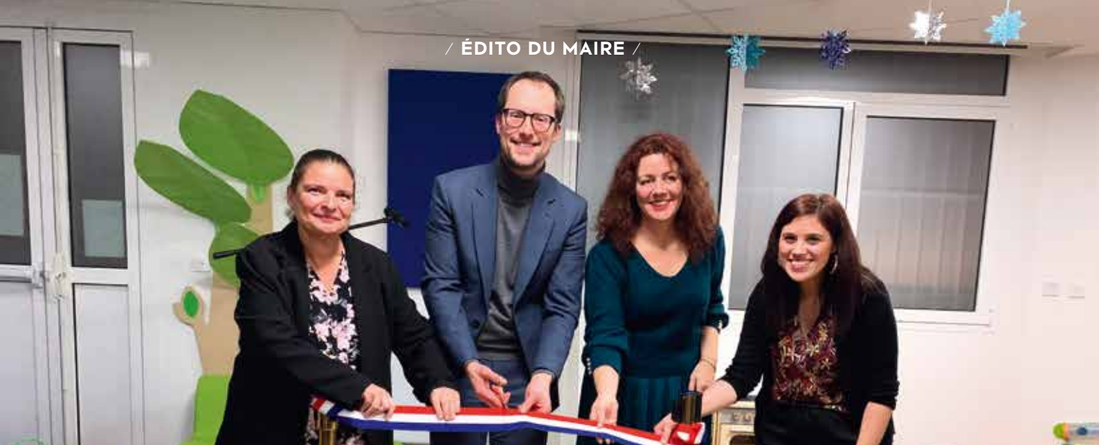
Lors de l'inauguration du Relais petite enfance.