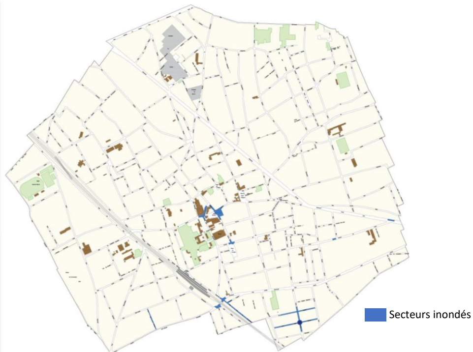
Inondations 22 juin 2021 – Houilles

Outre les problématiques liées aux inondations, ces ruissellements le long des voiries engendrent une dégradation de la qualité des eaux de surface qui se chargent de polluants.